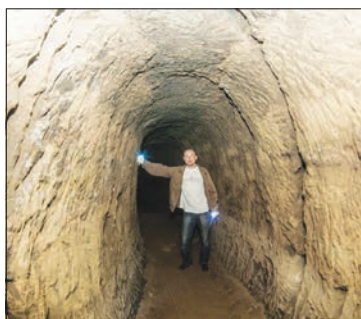
Знаменитый «Бакыр базы» – медный рудник в Сарманове

аграрным вопросам и председателем подкомитета по вопросам совершенствования законодательного обеспечения развития крестьянских (фермерских) хозяйств и кооперативных форм в АПК и сельских территориях Аграрного комитета Госдумы она часто бывает в регионах, оказывая реальную помощь своим коллегам. А вот татарстанцы возлагают на нее свои надежды. Казанские встречи Максимовой начались с Госсовета РТ.