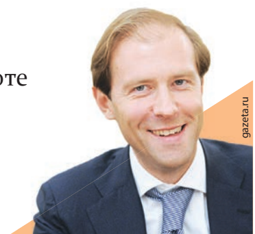
Денис Мантуров, министр промышленности и торговли РФ

По словам министра, это старая проблема, доставшаяся в наследство от застройки со-