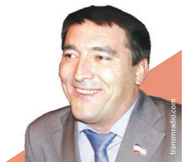
Рустам Темиргалиев, первый вице-премьер Республики Крым

В Крыму большая часть торговых учреждений уже перешла на российский стандарт по НДС, сообщил первый вице-премьер Республики Крым Рустам Темиргалиев.